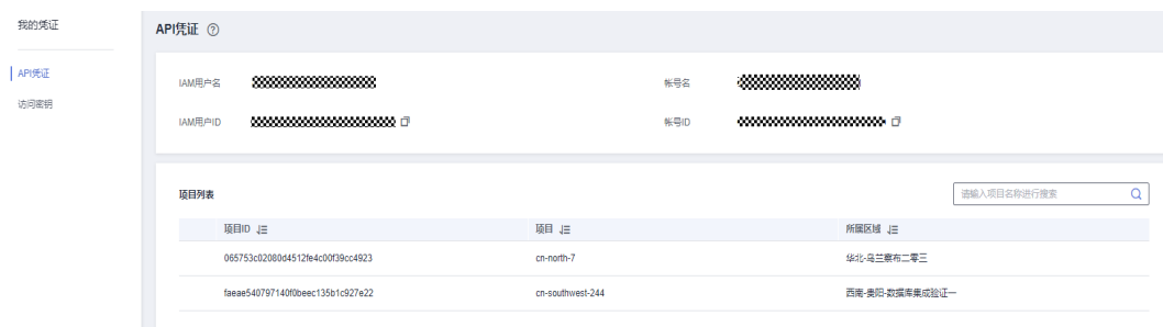
图 7-1 查看项目 ID